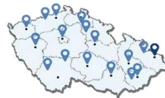
Rozmístění inkasních inspektorů v ČR